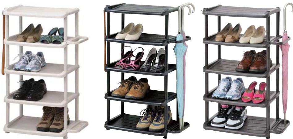
3102 シューズラック 5段 ダブル

入数 :10 カラー :BE・BK・BR サイズ :583×310×903 JANコード :BE/4906137310226 内寸 :407×280×205 (1段) BK/4906137310219 外箱サイズ :645×533×981 BR/4906137310233 材質 :P.P. 0 (552627)