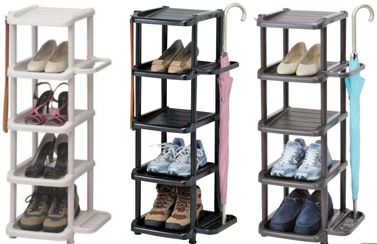
3101 シューズラック 5段 シングル

入数 :16 カラー :BE・BK・BR サイズ :380×310×903 JANコード :BE/4906137310127 内寸 :205×280×205 (1段) BK/4906137310110 外箱サイズ :880×620×575 BR/4906137310134 材質 :P.P. 0 (505813)