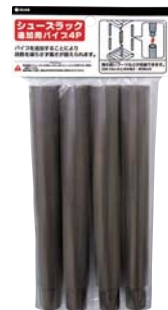
3103 シューズラック追加用パイプ4P

入数 :60 サイズ :φ25×202 外箱サイズ :446×276×385 材質 :P.P. カラー :BE・BK・BR JANコード :BE/4906137310332 BK/4906137310318 BR/4906137310325 1 (35721)